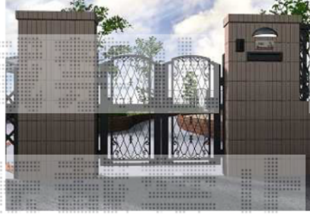
外構工事完成予想図