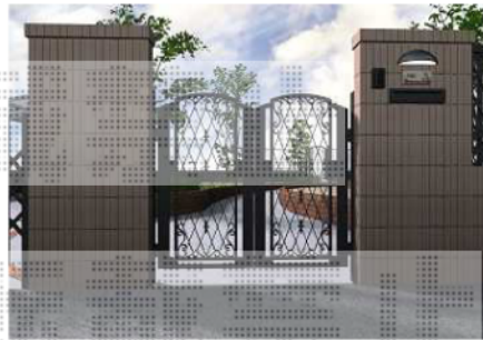
外構工事完成予想図