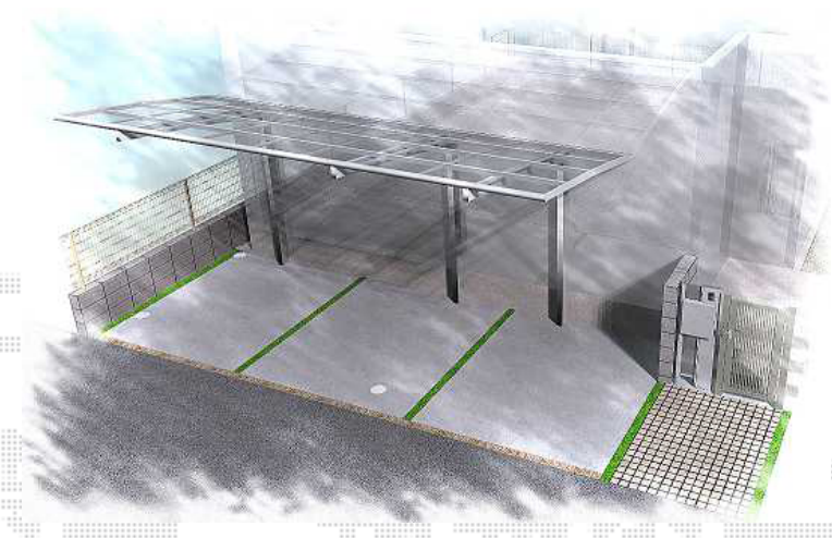
外構工事完成予想図