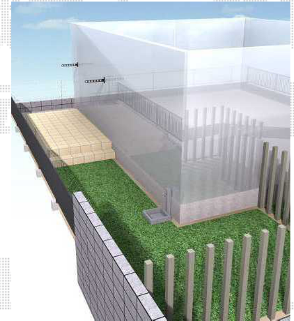
外構工事完成予想図