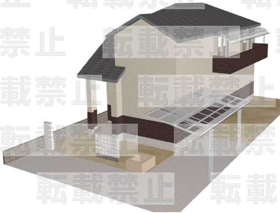
新設バルコニー屋根

トステム カーポートシグマIII 積雪~30cm対応 幅=2,701mm 奥行=5,686mm 色：シャイングレー 屋根材：ポリカーボネート（ブラウン） 柱仕様：ロング柱23仕様（有効高 約2,300mm） オプション：着脱式サポート（2本入り）