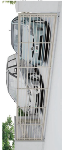
ワイドオーバーードA51型