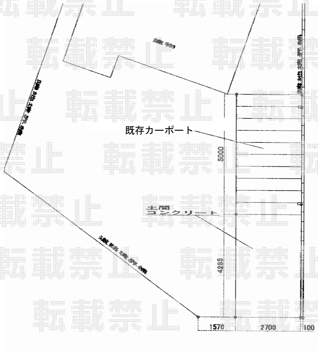
- 現況図 -