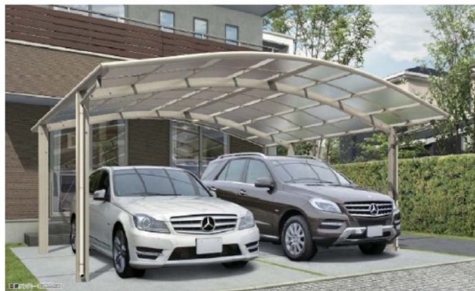
■基本セント 51-54 プラチナステン(ポリカ屋根ふき材:トーマイマット)