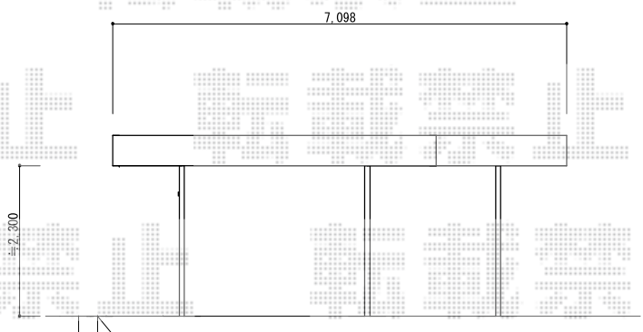
南北方向は道路一杯にて施工