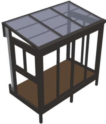
★パース図はイメージです。

トステム ほせるんですII F型 床納まり 積雪~20cm対応 寸法= 間口 関東1.5間 (2,730mm) × 出幅 5尺 (1,485mm) 正面ユニット: テラス (4枚建) 側面ユニット: 外観左側: 高窓4尺 (2枚建) / 外観右側: テラス5尺 (2枚建) 色: オータムブラウン 屋根材: 熱線吸収アクアポリカーボネート (ライトブルー) 床材: 塩ビデッキボード (木目) 施工方法: 下止め オプション: 網戸3方/戸袋逃げパネルセット