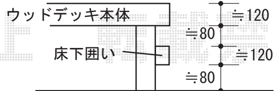
床下囲い 取付参考図面です

YKK AP リレーリア パーゴラ マテリアルカラー 間口=関東間1.5間 (2,730mm) 出幅=9尺 (2,670mm) 色：キャラメルチーク 追加部材：中間梁2本追加