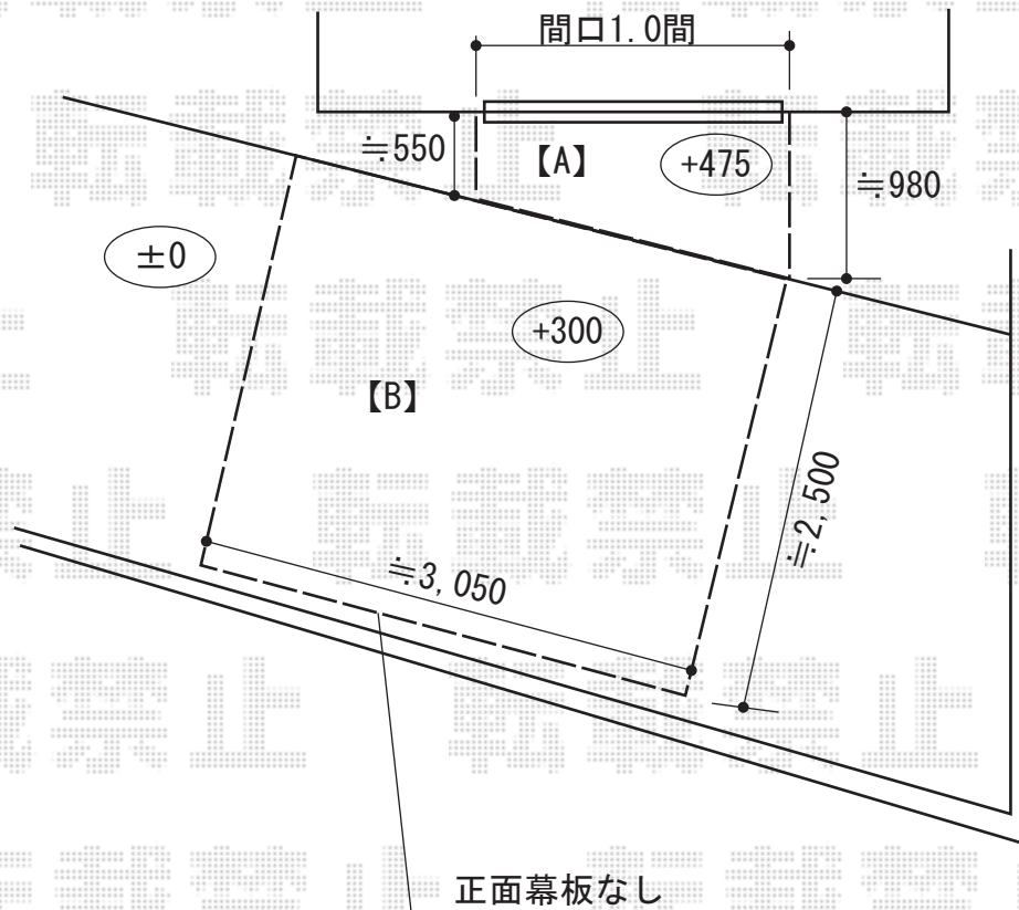
※【A】デッキ イメージ図