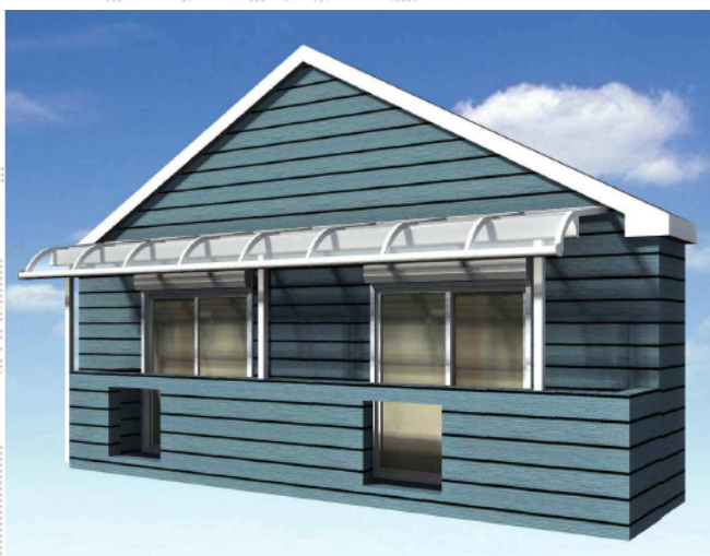
イメージパース（実際の柱位置は移動します）

トステム ライザーテラスII R型 屋根タイプ 連棟 積雪～20cm対応 間口=メーター6000[3000+3000]（柱芯々5,800mm 屋根幅6,020mm） 出幅=4尺（1,185mm） 色：ホワイト 屋根材：熱線吸収ポリカーボネート（ライトブルーマット調） 柱仕様：柱奥行移動タイプ（柱3本） 施工方法：上止め仕様 柱固定部品仕様：中間用×3 追加部材：ジャバラ（¥900）×1