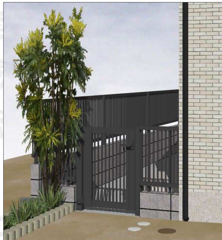
※イメージパースであり実際の寸法とは異なります。