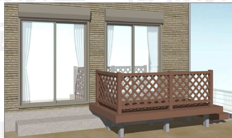
※イメージベースであり実際の寸法とは異なります。