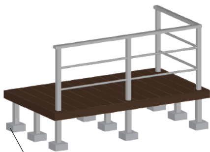
既存犬走りコンクリートへアンカー固定