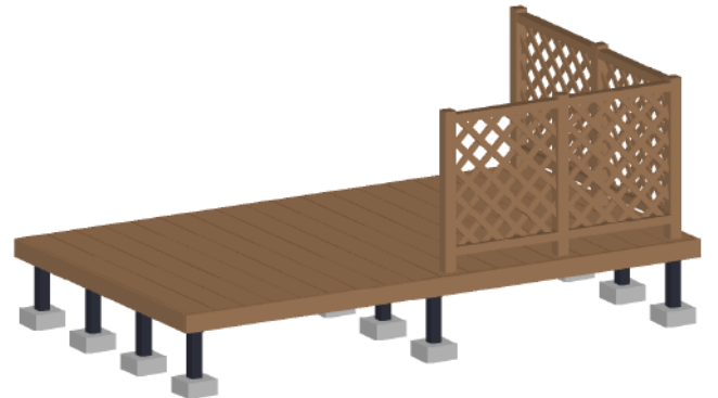
※パース図に段床は含まれておりません。