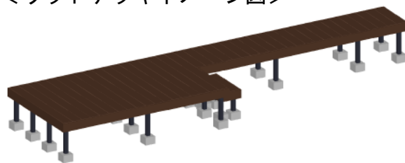
<ウッドデッキイメージ図>

YKK AP 独立式リウッドステップ2型 色: 床板/レッドブラウン 束柱/カームブラック