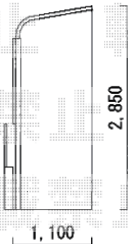
2間×4尺テラス 前面パネル付き

YKK AP ヴェクターテラス R型 テラスタイプ 単体 積雪～20cm対応 間口= 関東間2.0間 (柱芯々3,485mm 屋根幅3,670mm) 出幅= 4尺 (1,170mm) 色: プラチナステン 屋根材: ポリカーボネート (トーマイマット) 柱仕様: 柱標準タイプ (柱2本) 施工方法: 下止め仕様