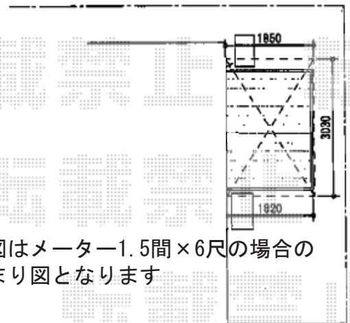
<ウッドデッキ/テラス屋根>

YKK AP リウッドデッキ 200 間口= 1.5間（2,651mm） 出幅= 6尺（1,820mm） 色： ホワイトブラウン 床板： 縦貼り 幕板： 標準幕板 束柱： Tタイプ（400～550mm）（色： プラチナステン）