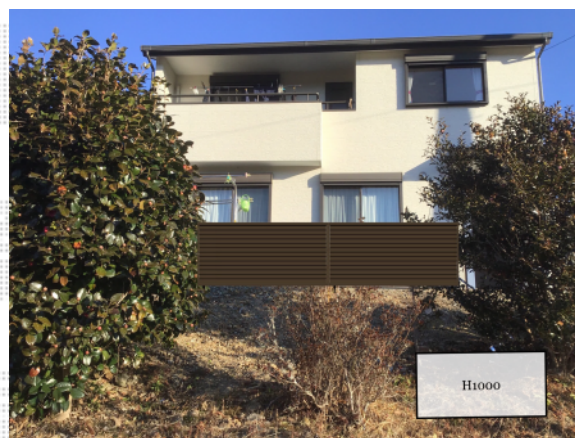
※イメージとなります