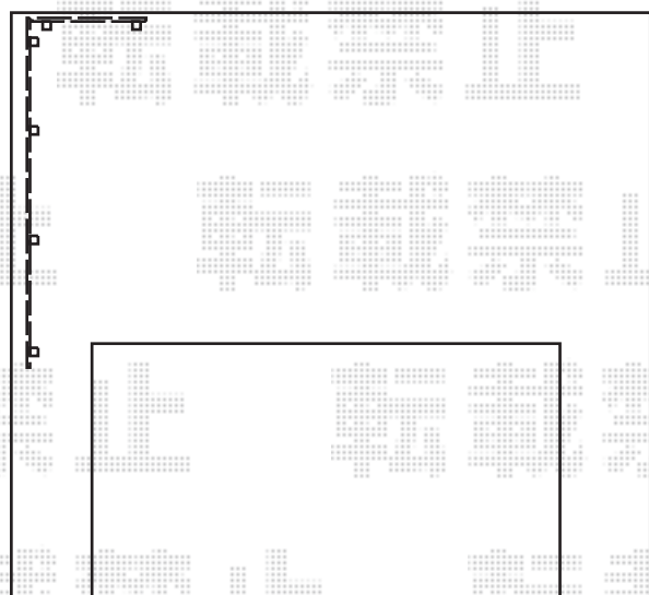
②上段T100 + 下段T60

Value Select ミエーネフェンス 目隠しルーバータイプ 2段支柱 自立建て用(パネル2段) 本体1枚 (W×H) = T100 (1,975mm×920mm) × 4本 本体1枚 (W×H) = T60 (1,975mm×520mm) × 4枚 2段支柱(独立専用) : T170 (1,722.5mm) × 6本 目隠しコーナー継手 : T100 × 1セット 目隠しコーナー継手 : T60 × 1セット 端部キャップ : × 2セット 色 : ノーブルステン