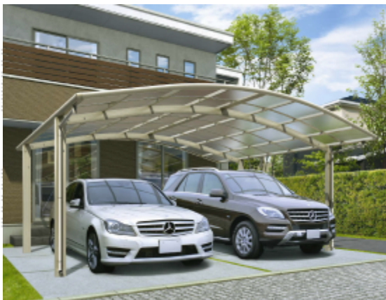
※図はイメージです