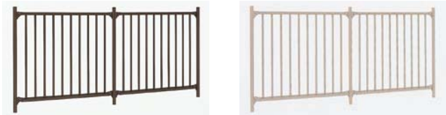
オータムブラウン