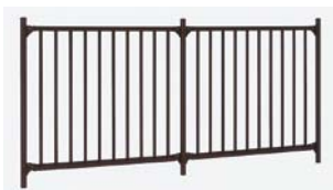
マイルドブラック