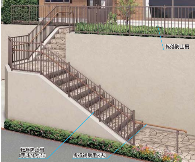
階段部分 転落防止柵(手すり付き)+歩行補助手すり フロントビーム1段 連続施工 (転落防止柵:オータムブラウン ビーム:φ38手すり S-TOEXブラウン) 高台部分 転落防止柵(オータムブラウン)