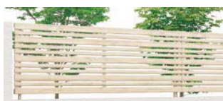
エクリュアイボリー (EH) T-8