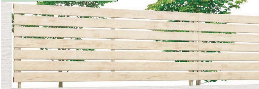
エクリュアイボリー (EH) T-8