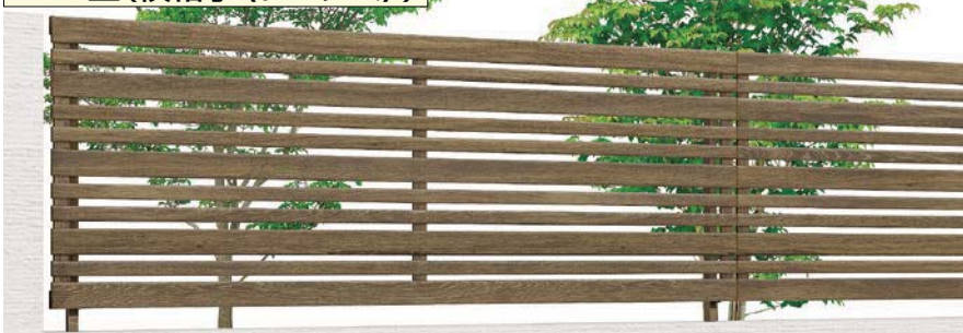
ラステックオーク (WR) T-8