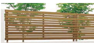
チェリーウッド (WP) T-8