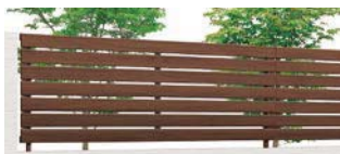
クリエモカ (RA) T-8