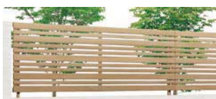
オーク (WQ) T-8