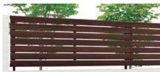
クリエダーク (SA) T-8