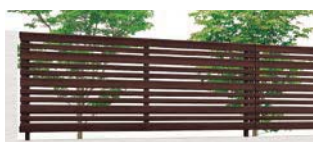
クリエダーク (SA) T-8