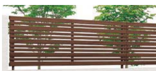
クリエモカ (RA) T-8