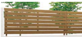
チェリーウッド (WP) T-8