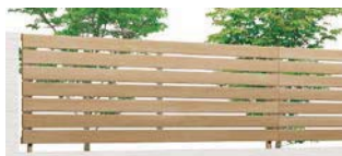
オーク (WQ) T-8