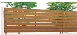
クリエラスク (QA) T-8