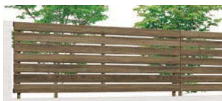
ラステックオーク (WR) T-8