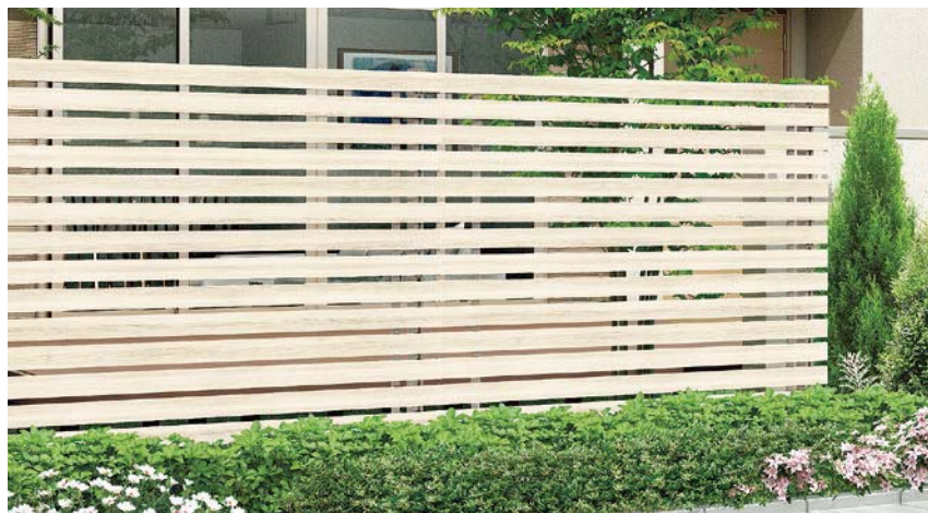
シャイングレー+エクリュアイボリー T-18