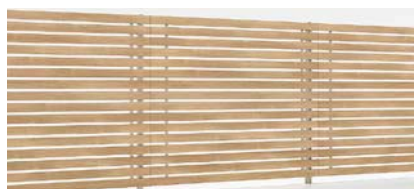
シャイングレー+オーク T-18