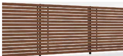
ブラック+クリエモカ T-18