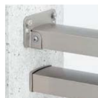
壁付け部品 ※写真はF2型です。