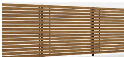
ブラック+チェリーウッド T-18