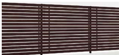
ブラック+クリエダーク T-18