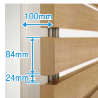
施工厚みと格子ピッチ