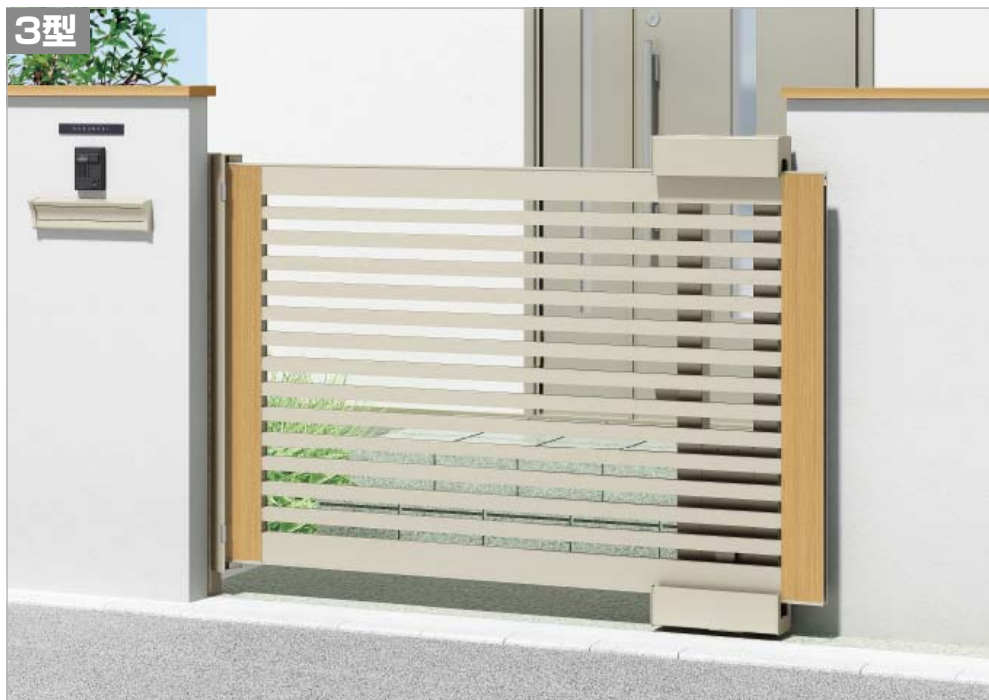
ライトブラウン(1812サイズ)