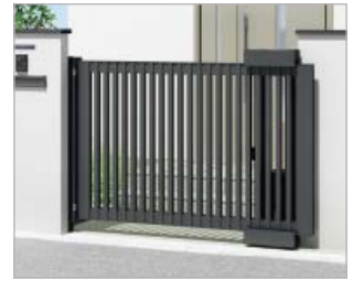
ブラックつや消し