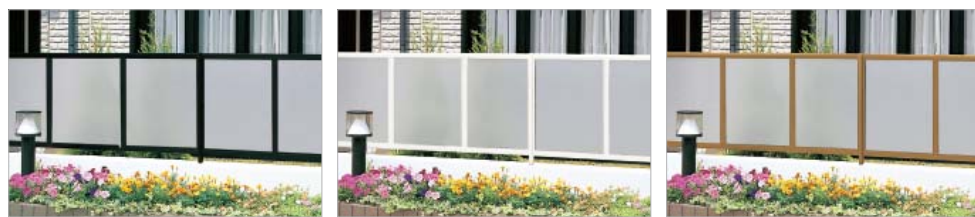
ブラックつや消し (間柱仕様) アイボリーホワイト (間柱仕様) ブロンズ (間柱仕様)