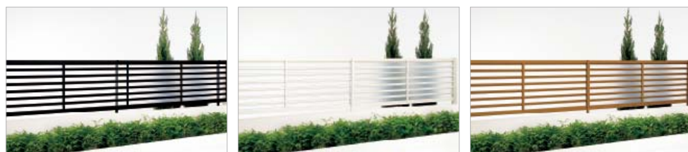
ブラックつや消し (0820サイズ・自由支柱仕様) アイボリーホワイト (0820サイズ・間柱仕様) ブロンズ (0820サイズ・間柱仕様)