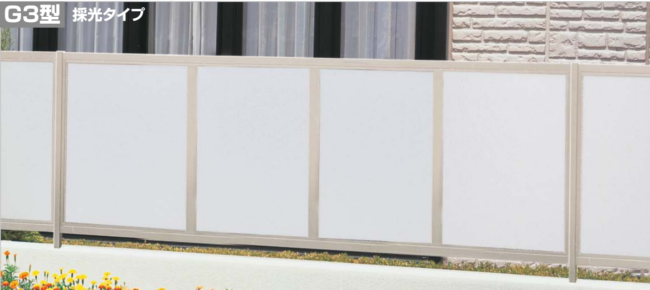
ステンカラー (0820サイズ・間柱仕様)