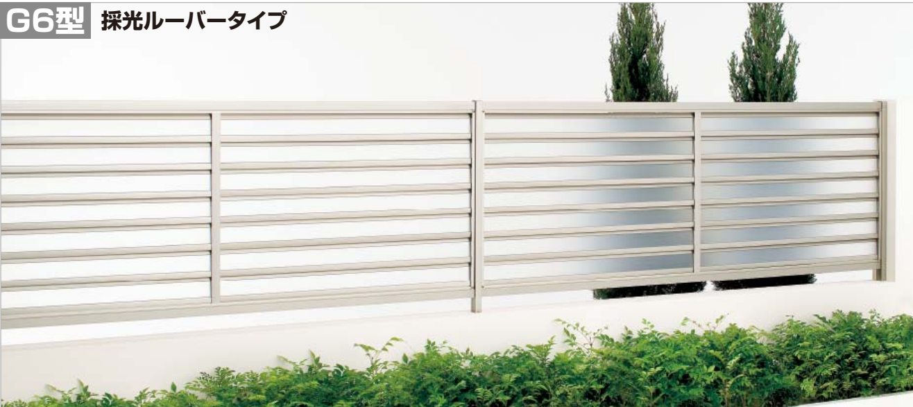
ステンカラー (0820サイズ・間柱仕様)