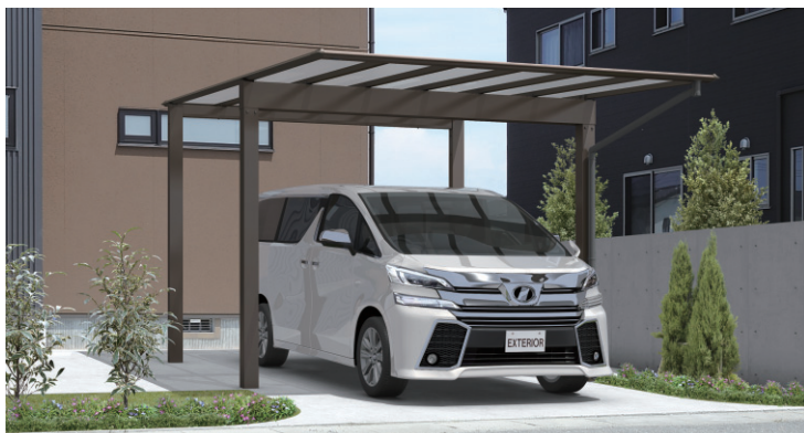
形材屋根枠/ダークブロンズ/奥行片寄せタイプ/5033/H25/ポリカーボネート板(かすみ調):かすみ