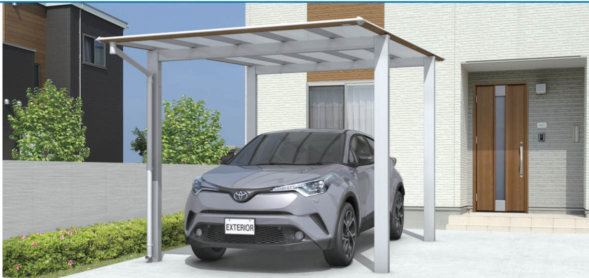
木調屋根枠/JCL(オレンジチェリー・サンシルバー)/基本タイプ/5028/H23/ポリカーボネート板(かすみ調):かすみ