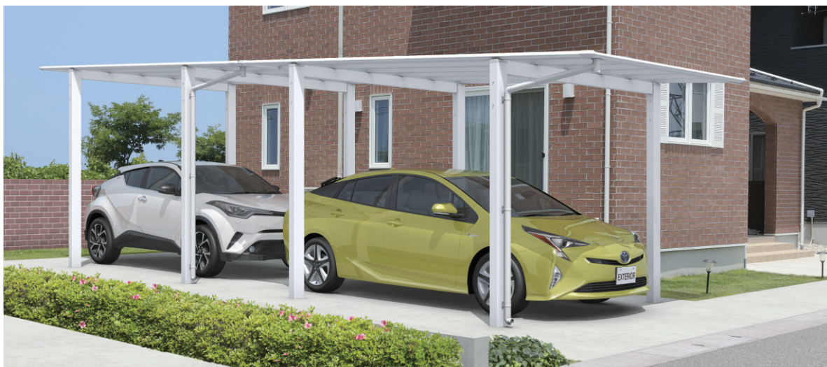
形材屋根枠/ホワイト/奥行2連結タイプ/(50・50)28/H23/ポリカーボネート板(かすみ調):かすみ