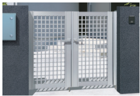
サンシルバー/打掛け錠(スタンダードタイプ) / 0712/すき間ガード(吊元側)