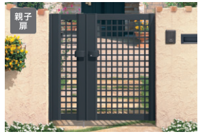
ブラック/タッチ錠(スタンダードタイプ) (08・04) 12/すき間ガード(吊元側)