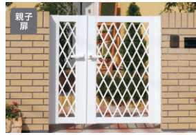
ホワイト/打掛け錠(スタンダードタイプ) (08・04) 12/すき間ガード(吊元側)