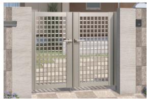
アーハングレー/打掛け錠(スタンダードタイプ) / 0712/すき間ガード(吊元側)