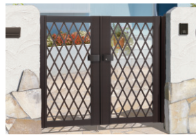
ダークブロンズ/タッチ錠(スタンダードタイプ) / 0712/すき間ガード(吊元側)