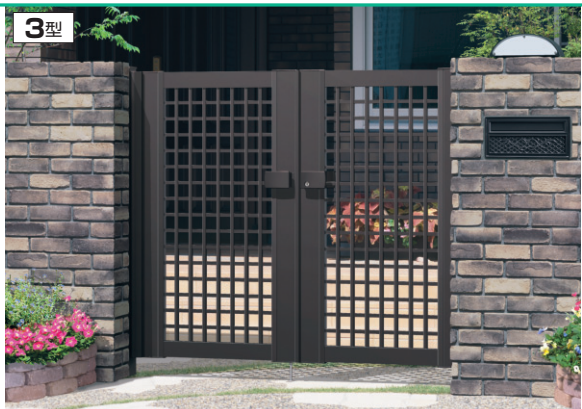
3型 ダークブロンズ/タッチ錠(スタンダードタイプ) / 0712/すき間ガード(吊元側) / 照明:MW9型

色 サンシルバー(SLC) アーハングレー(U.C) ダークブロンズ(BD) ブラック(KC) ホワイト(WH) ブロンズ(BR) アースブラウン(BNC) 材質 アルミ材 3・4・6型のみ設定 6型のみ設定 5型のみ設定