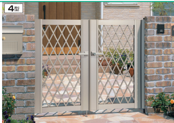
4型 アーハングレー/打掛け錠(スタンダードタイプ) / 0712/すき間ガード(吊元側)