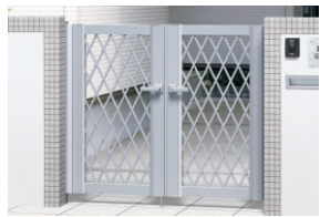
サンシルバー/打掛け錠(スタンダードタイプ) / 0712/すき間ガード(吊元側)