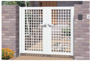
ホワイト/打掛け錠(スタンダードタイプ) / 0712/すき間ガード(吊元側)