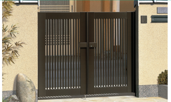
ダークブロンズ/タッチ錠 (スタンダードタイプ) / 0712 / すき間ガード (吊元側)