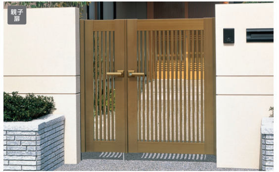
ブロンズ/打掛け錠 (スタンダードタイプ) / (08-04) 12 / すき間ガード (吊元側)