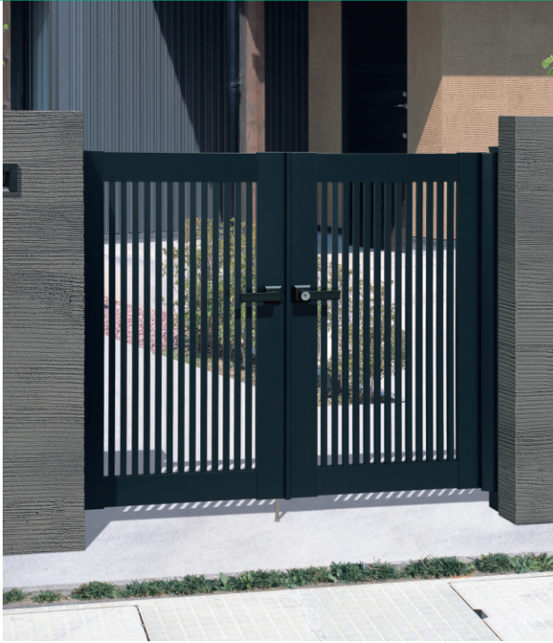
ブラック/打掛け錠 (スタンダードタイプ) / 0712 / すき間ガード (吊元側)