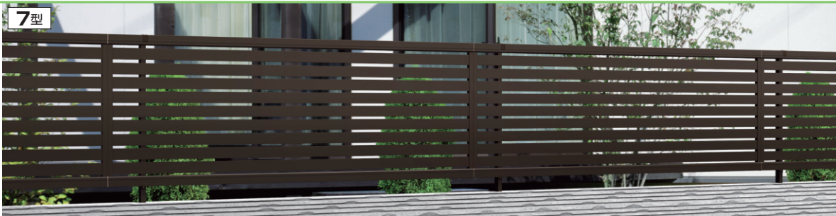
7型 ダークブロンズ/2008