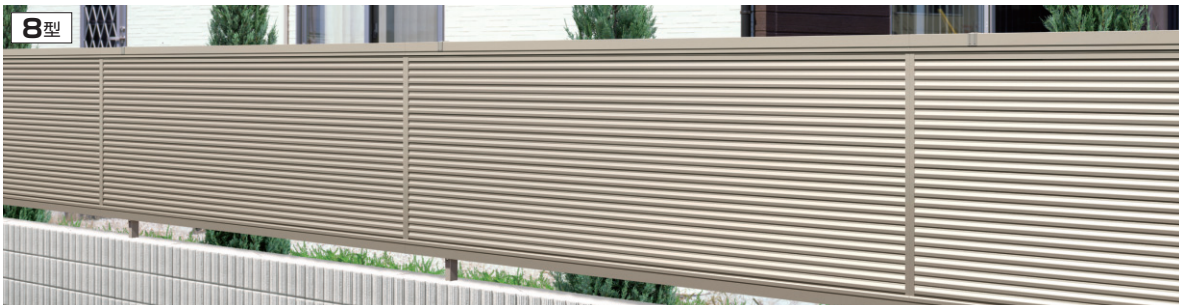
8型 アーバングレー/2008