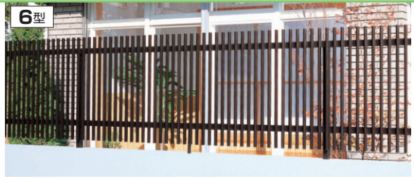
6型 ダークブロンズ/2008