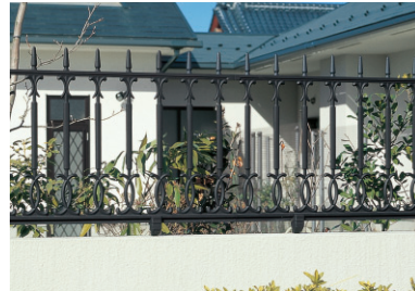
3型 アートブラック / 1006