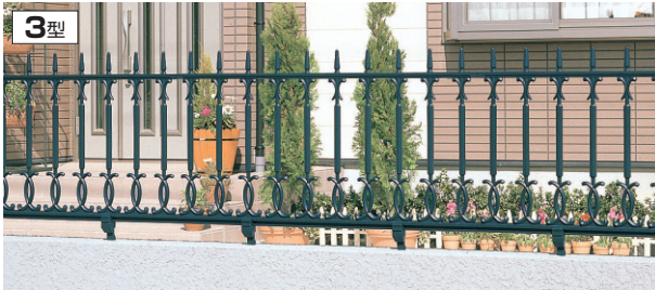
3型 アートグリーン / 1006