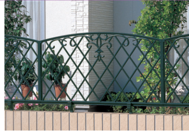
1型 アートグリーン / 1006