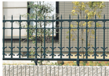
4型 アートグリーン / 1006