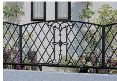
6型 アートブラック / 1006