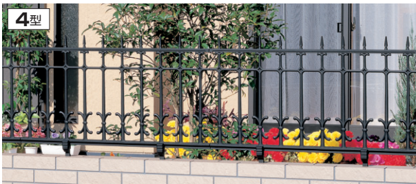
4型 アートブラック / 1006