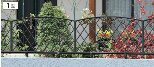
1型 アートブラック / 1006