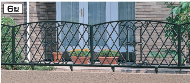
6型 アートグリーン / 1006