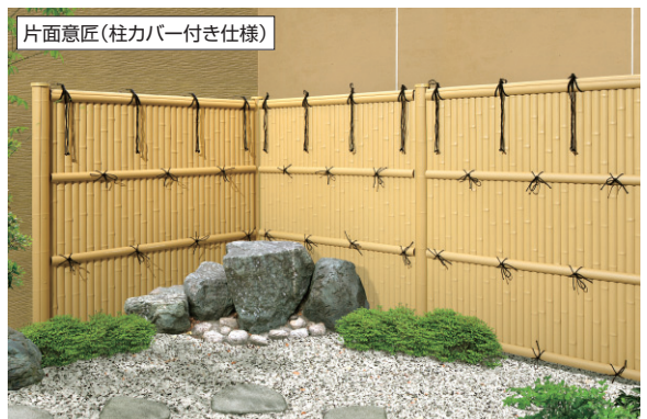
片面意匠(柱カバー付き仕様)