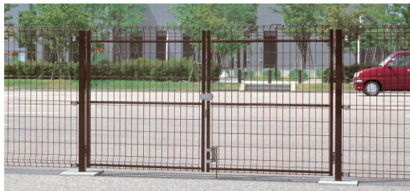
ダークブロンズ/2015両開き/フェンス: ヌメッシュG型