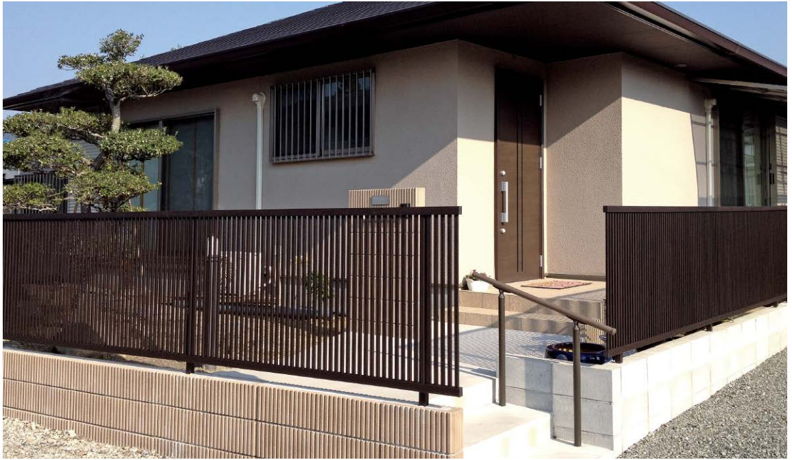
エバーアートフェンス 縦細格子 京町家かきちゃ