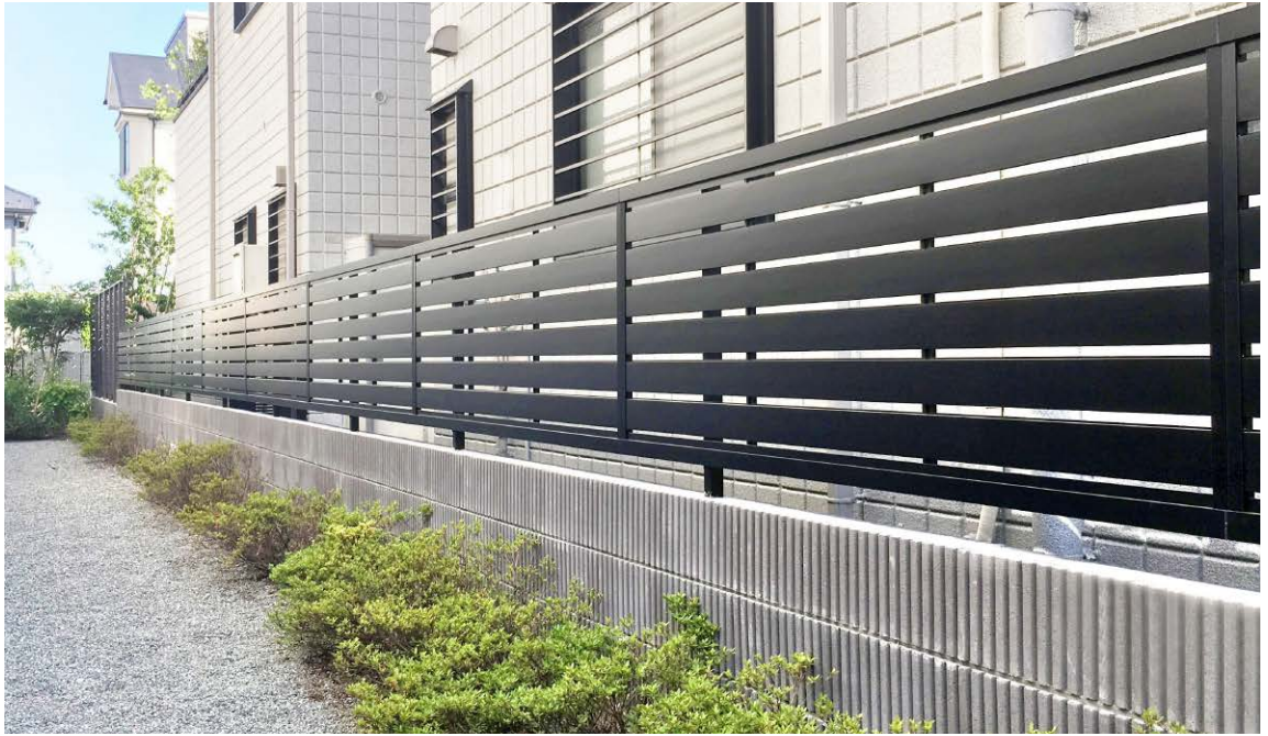
エバーアートフェンス センシア 横パネル ブラック