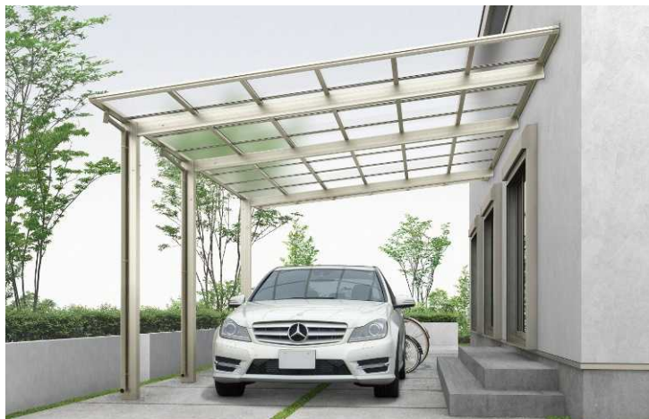
J51・14-39H プラチナステン色(ポリカ屋根ふき材: トーマイマツト色)