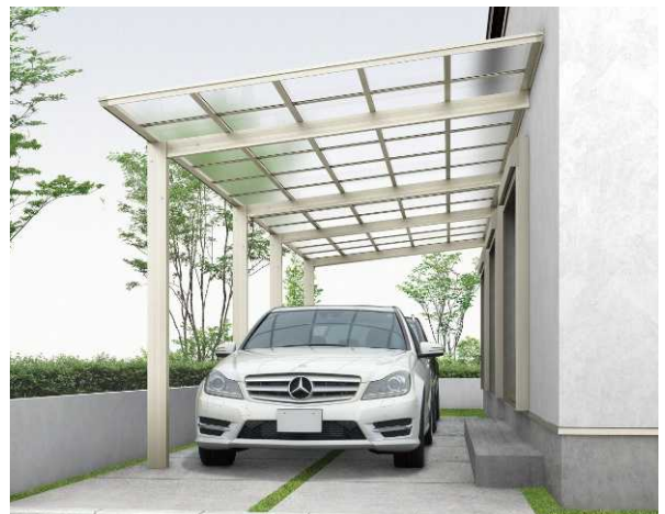
J51・51-30H プラチナステン色(ポリカ屋根ふき材: トーマイマツト色)