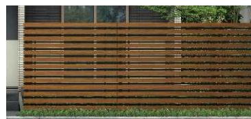
T200 キャラメルチーク/ブラック色