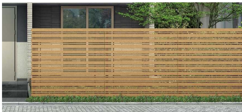
T200 ハニーチェリー色