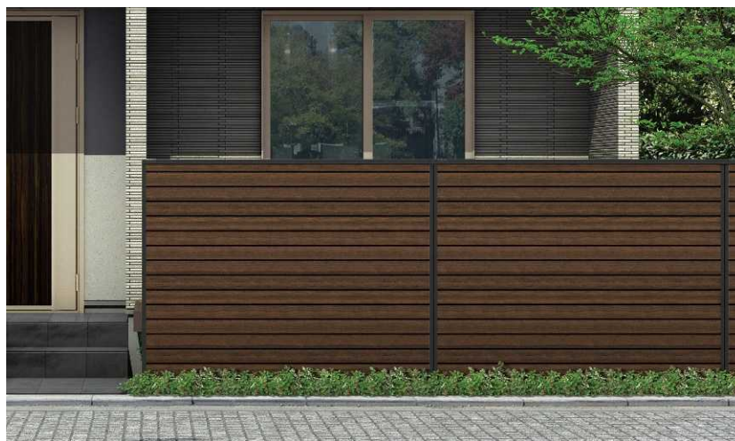
T160 ショコラウォールナット/ブラック色

※パネルがカームブラック色またはブラチナステン色の場合、例えばパネルがキャラメルチーク色ではキャラメルチーク/ブラック色、またはキャラメルチーク/ステン色などと呼称します。 枠・柱がカームブラック色またはブラチナステン色の場合、パネルの背面は、すべてカームブラック色またはブラチナステン色となります。