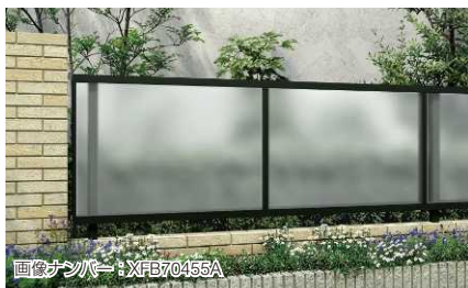
画像ナンバー: XFB70455A T80 カームブラック色