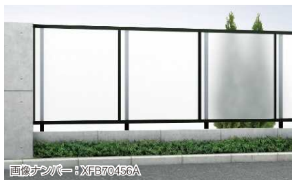
画像ナンバー: XFB70456A T120 カームブラック色 ※支柱は1mピッチとなります。