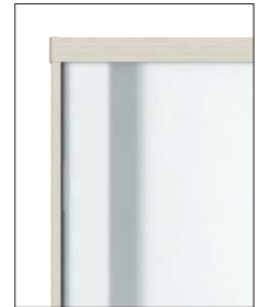
パネル: 透明すりガラス調