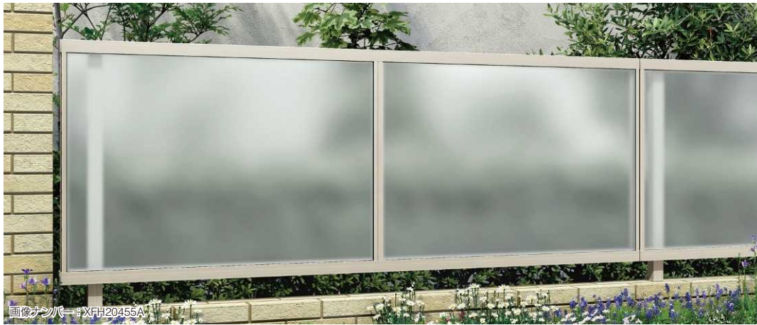
画像ナンバー: XFH20455A T80 プラチナステン色