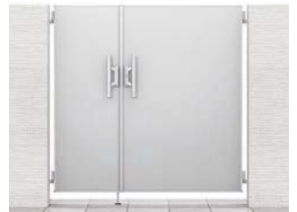
ポリッシュシルバー 05・09-14 親子仕様 柱使用 錠:プッシュプルRB錠(LS)