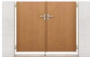
クリエラスク 07-12 両開き 柱使用 錠:シリンダーRD錠(SC)