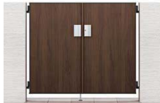
クリエモカ 07-12 両開き 柱使用 錠:プッシュプルUT錠(LS)