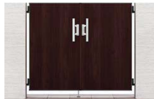
クリエダーク 07-12 両開き 柱使用 錠:プッシュプルRB錠(LS)