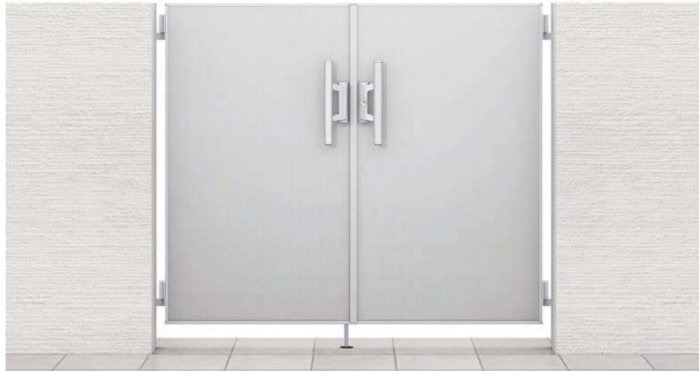
ポリッシュシルバー 07-12 両開き 柱使用 錠:プッシュプルRB錠(LS) セット価格 ¥268,700