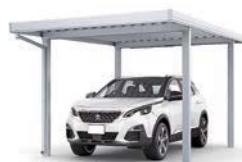
30-55型 ナチュラルシルバー