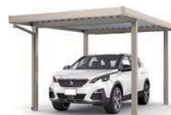
30-55型 シャイングレー