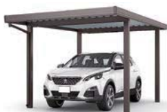
30-55型 オータムブラウン