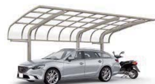
シャイングレー 27-50-14型 屋根材色:クリアマット