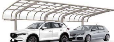
シャイングレー 27-50型 屋根材色:クリアマット