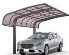
オータムブラウン 27-50型 屋根材色:クリアブラウン