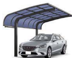
ブラック 27-50型 屋根材色:クリアブルー