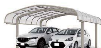
シャイングレー 27-27-50型 屋根材色:クリアマット