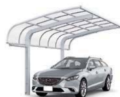
ナチュラルシルバー 27-50型 屋根材色:クリアマット