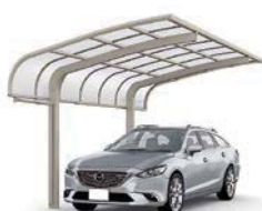
シャイングレー 27-50型 屋根材色:クリアマット