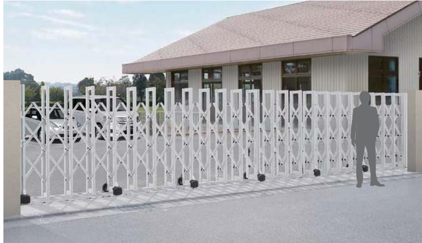
ナチュラルシルバー F: H:1600 フラットレールタイプ 片開き