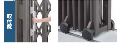
取付錠 グランシャイン錠 フラットレールタイプ