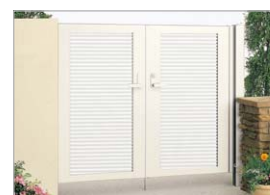
アイボリー ホワイト