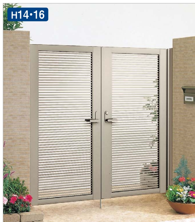
ステンカラー(0816サイズ・47:Vレバー ハンドル錠)