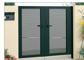
ブラックつや消し