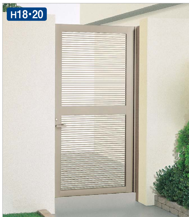
ステンカラー(1020サイズ・57:Vレバー ハンドル錠)