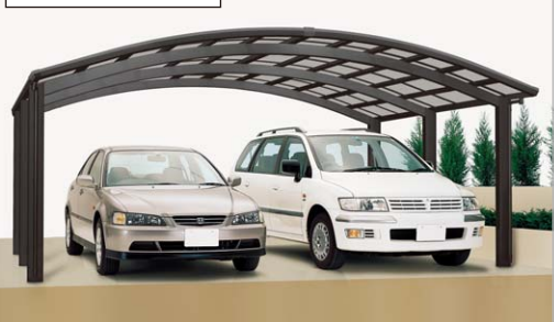
ブラックつや消し