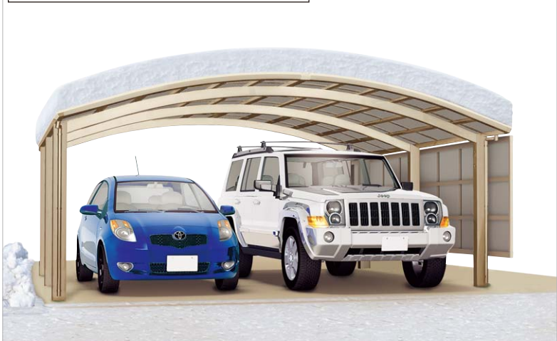
ステンカラー (5450サイズ・熱線吸収ポリカーボネート板)、サイドパネルはオプション