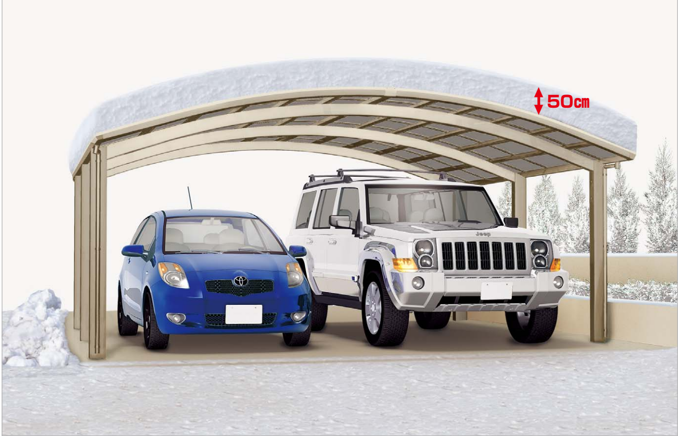
ステンカラー (5450サイズ・熱線吸収ポリカーボネート板)