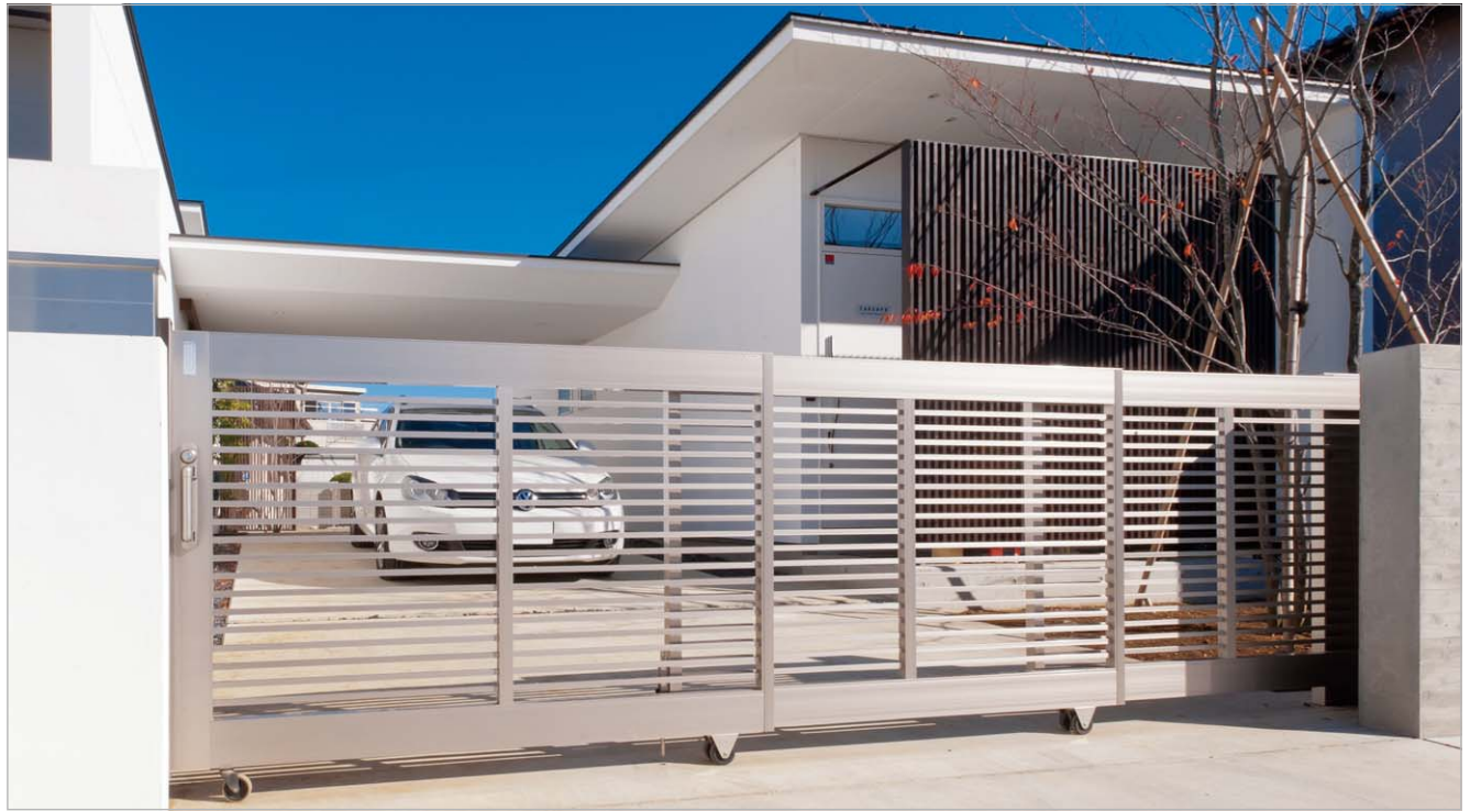
ステンカラー(4512サイズ)