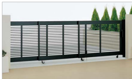
ブラックつや消し(4512サイズ)