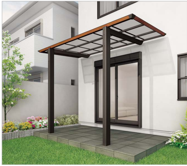
ブラックつや消し+マロンブラウン(3719サイズ)