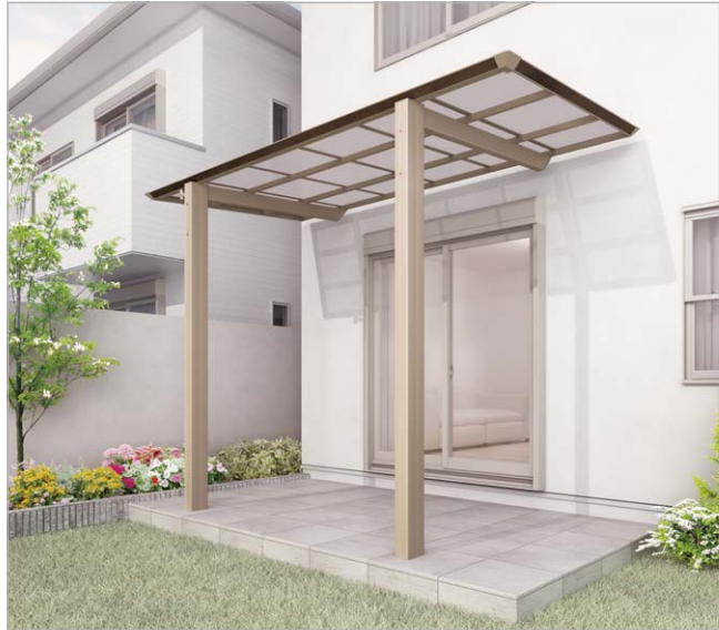
ステンカラー+セピアブラウン(3719サイズ)